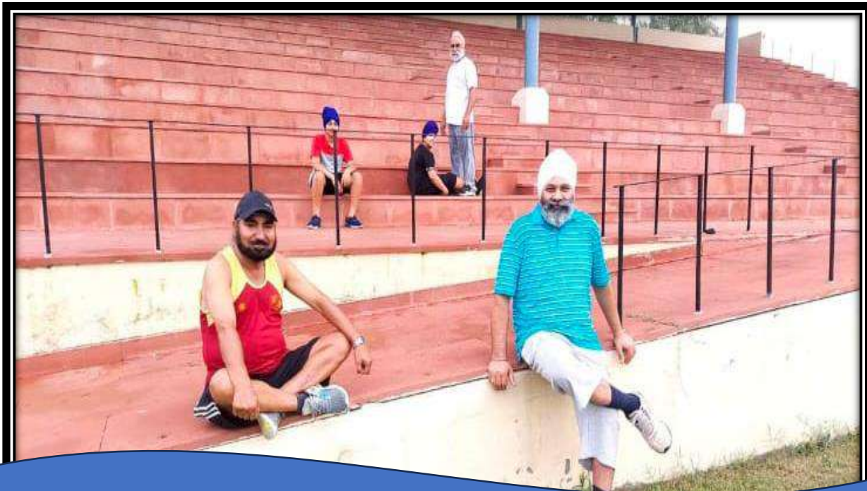
College grounds are utilised by local community for morning and evening walks.