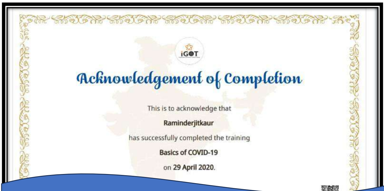
COVID Training Completion Certificates of the Faculty Members