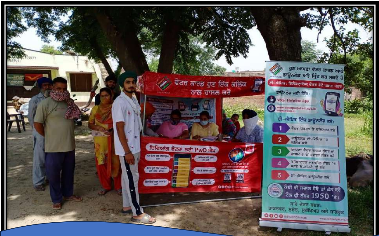
SVEEP activities organised at various levels for voter awareness.