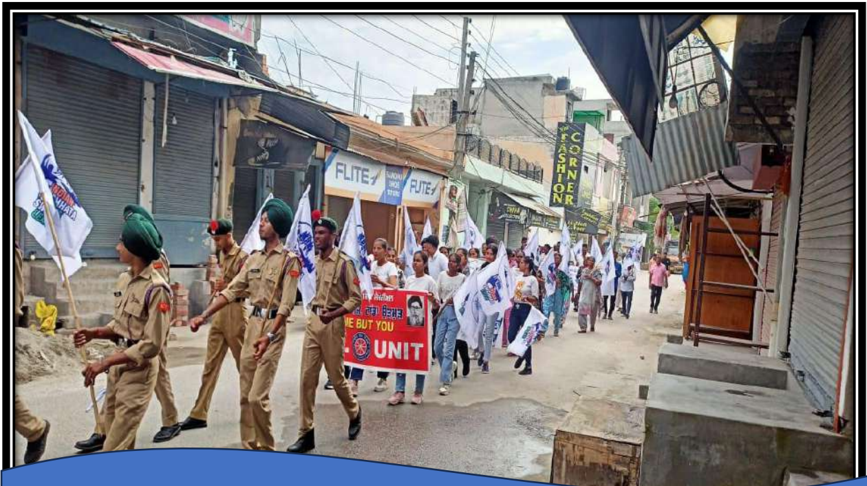
NSS volunteers participating in cleanliness drive at various levels.