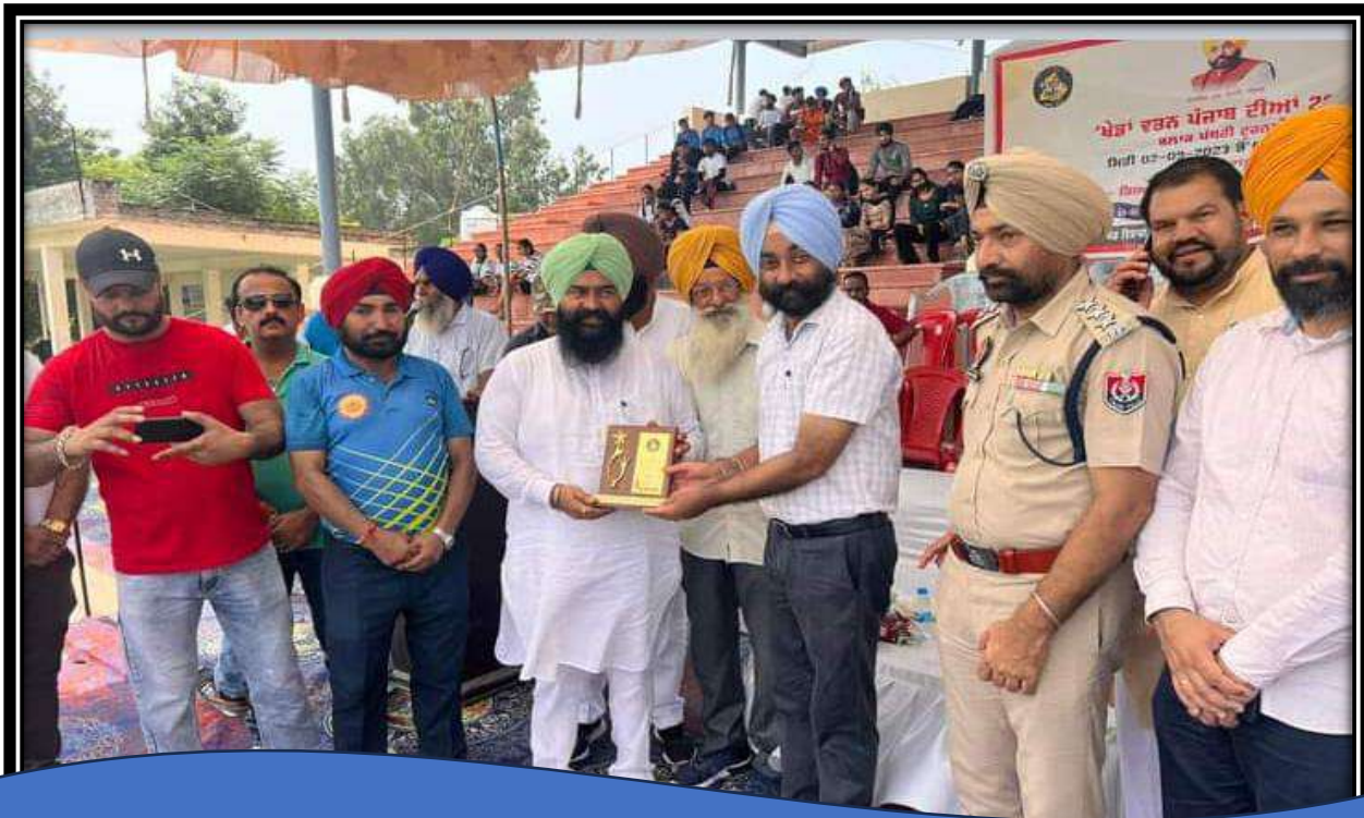
College grounds are open for sports tournaments organised at district, zonal and state levels.