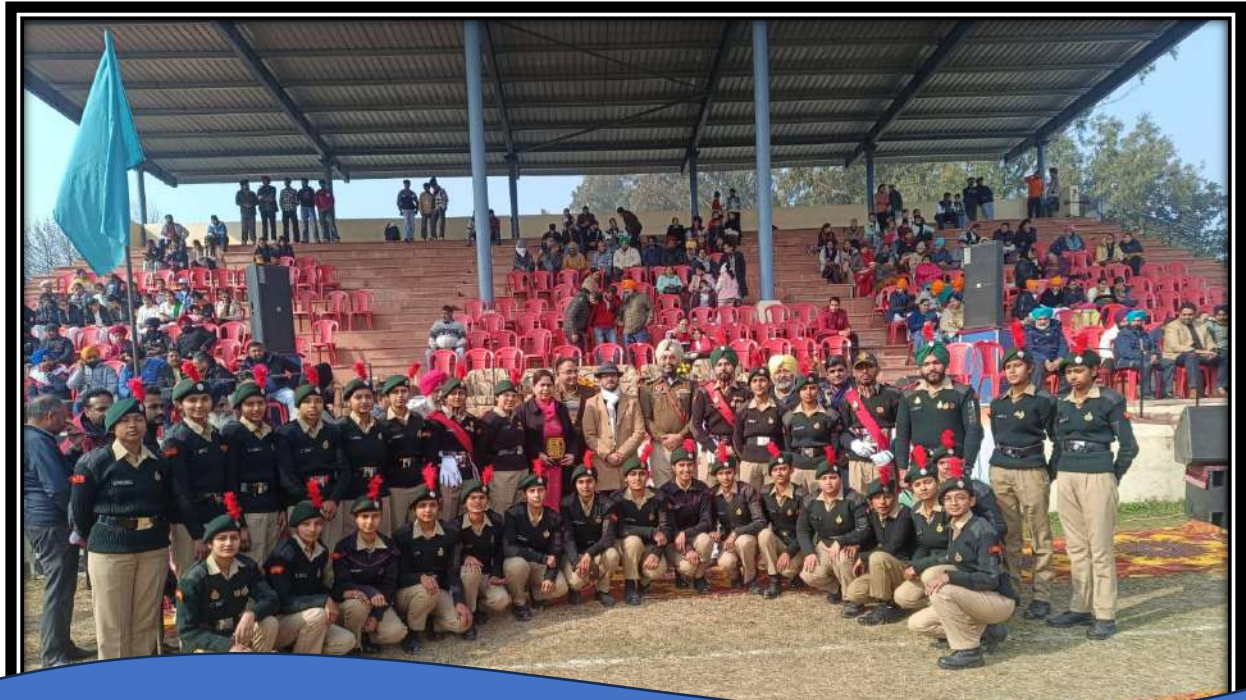
NCC cadets participating in college and tehsil level Republic Day celebrations.