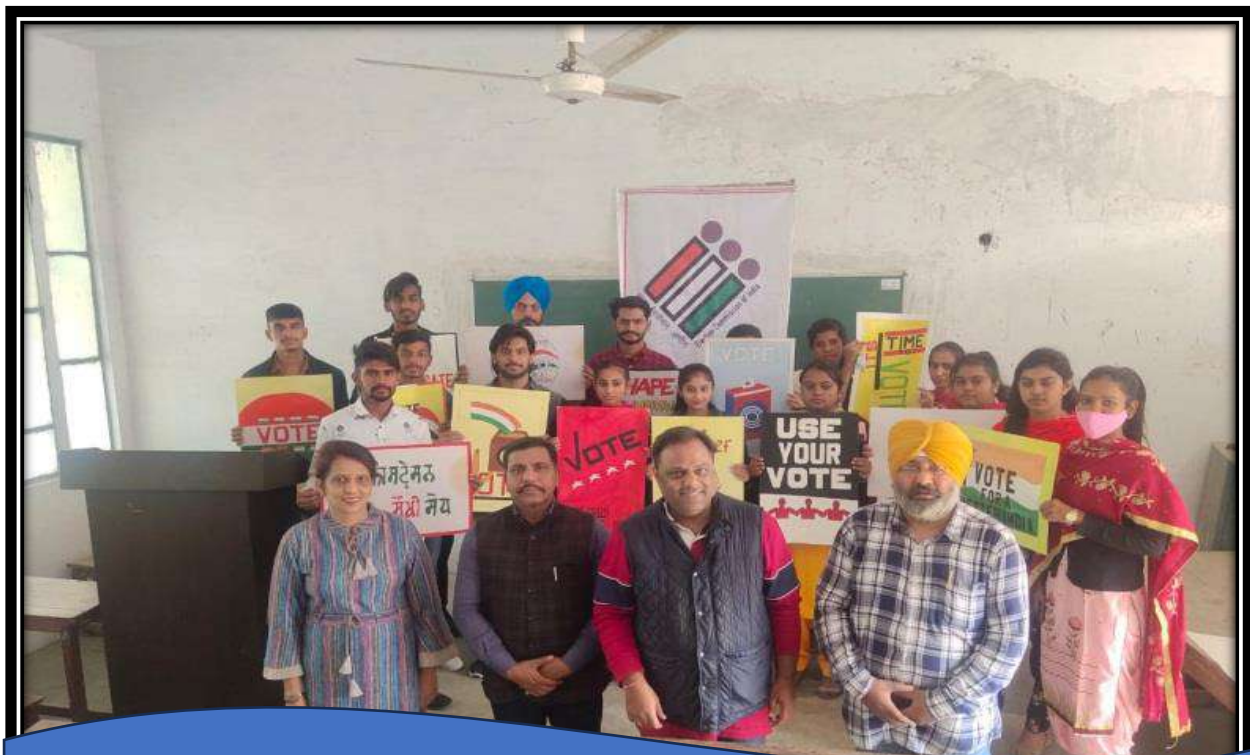
SVEEP activities organised at various levels for voter awareness.