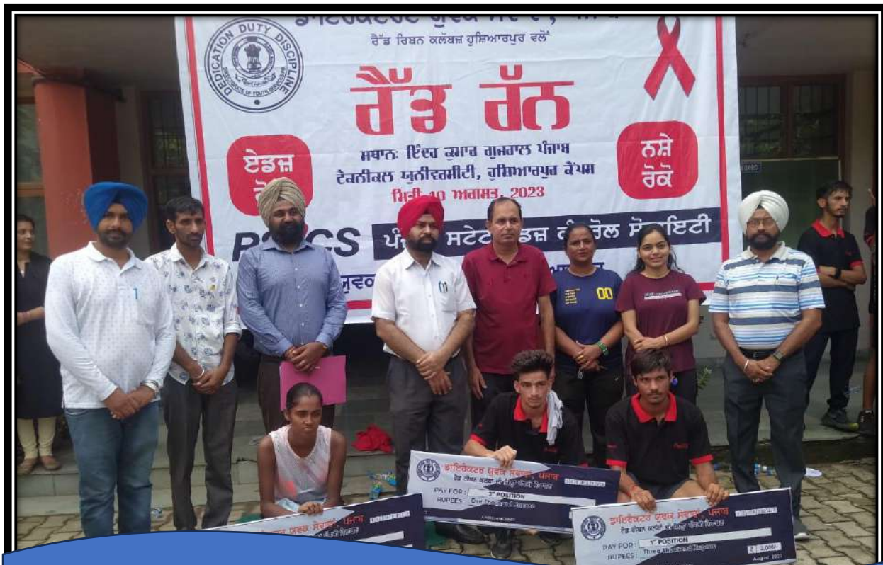
Volunteers from NSS and Red Ribbon Club participating in various community awareness programs.