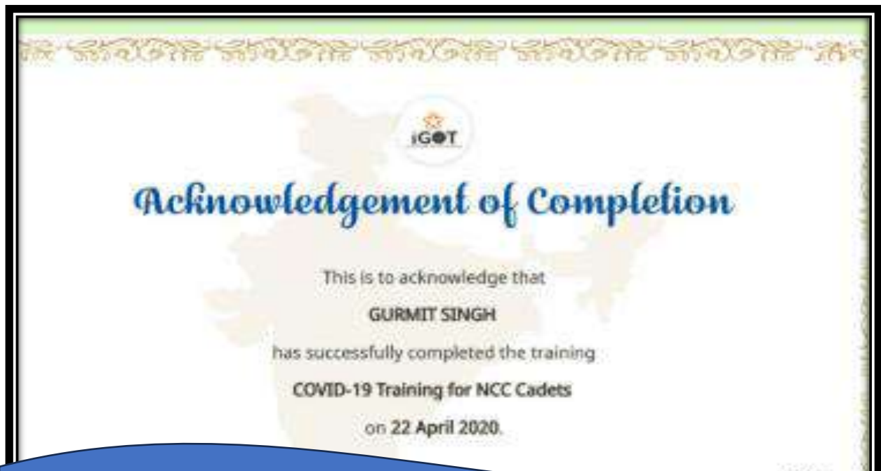
COVID Training Completion Certificates of the Faculty Members