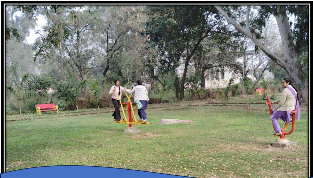
People from neighbourhood community utilising the equipment in the open gym installed by the state government.